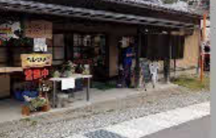
ベレファ・カフェ