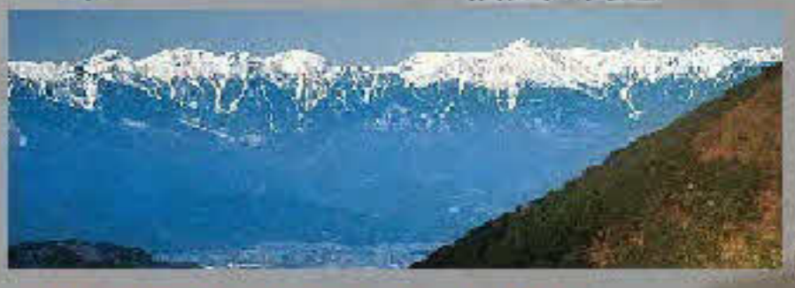
保福寺峠から北アルプスを望む 槍ヶ岳も見える