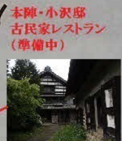
本陣・小沢邸 古民家レストラン (準備中)