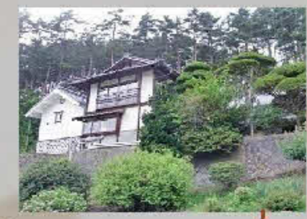
手打ちそば ほそばら