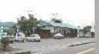
寄ってけや福寿草