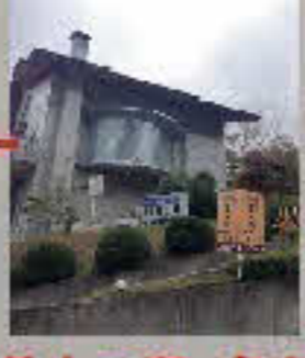
美人の湯・東山館