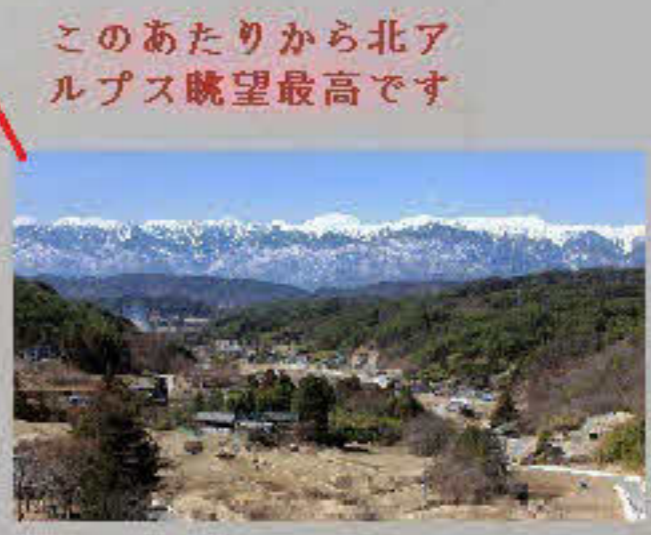
このあたりから北アルプス眺望最高です