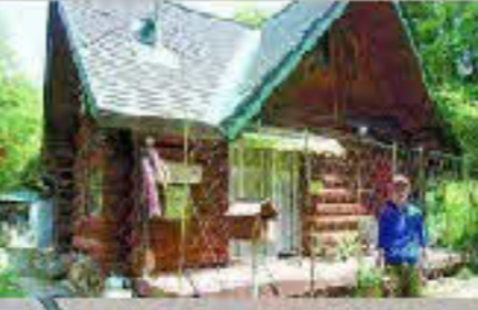
体験民宿 コミちゃん ブーム