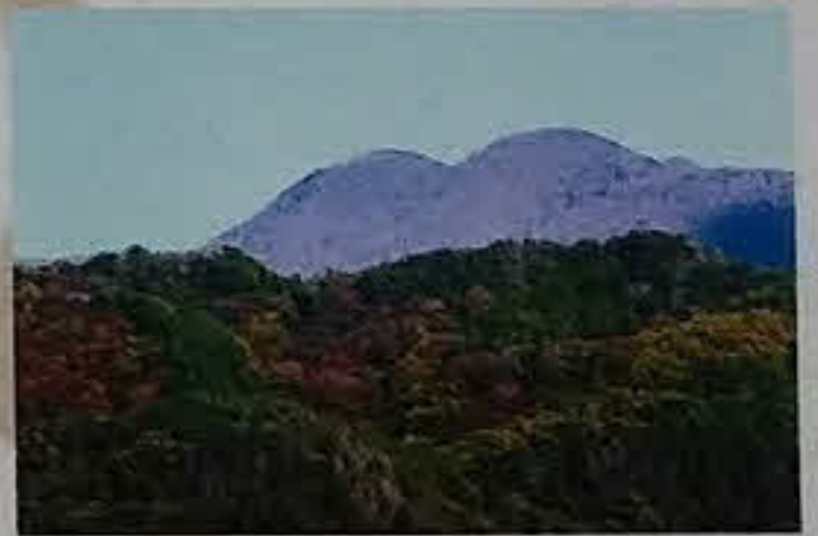
▲入山 (けつだしやま)