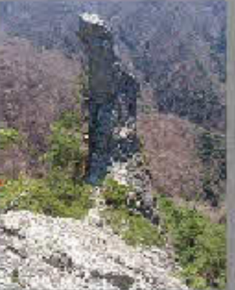
クライマーの名所 烏帽子岩は一度は訪れてみたいところ