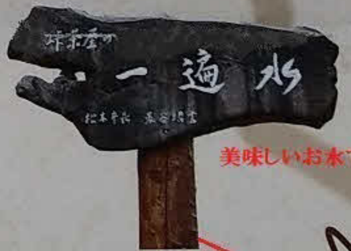
美味しいお水です