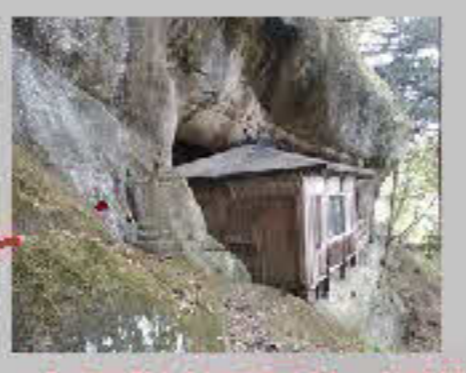
虚空蔵山岩屋社 (両瀬)