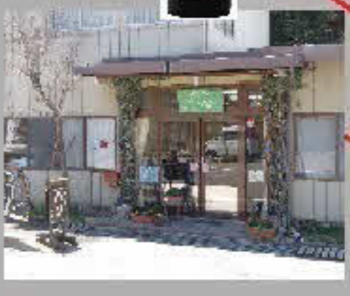
国産小麦・パン工房 ロティ